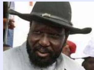
Sud-Soudan : Salva Kiir lance la monnaie nationale