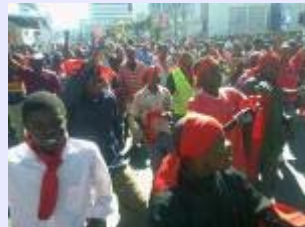
Malawi: Flambée de violence lors des manifestations