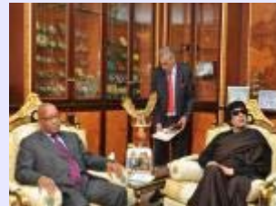
La Chine derrière l'UA pour résoudre la crise libyenne