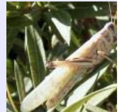
Madagascar lutte contre l'invasion de criques