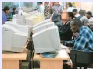
Afrique: Bharti Airtel annonce un accord avec IBM