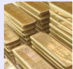
Cours de l'or: Le Séne rate le marché